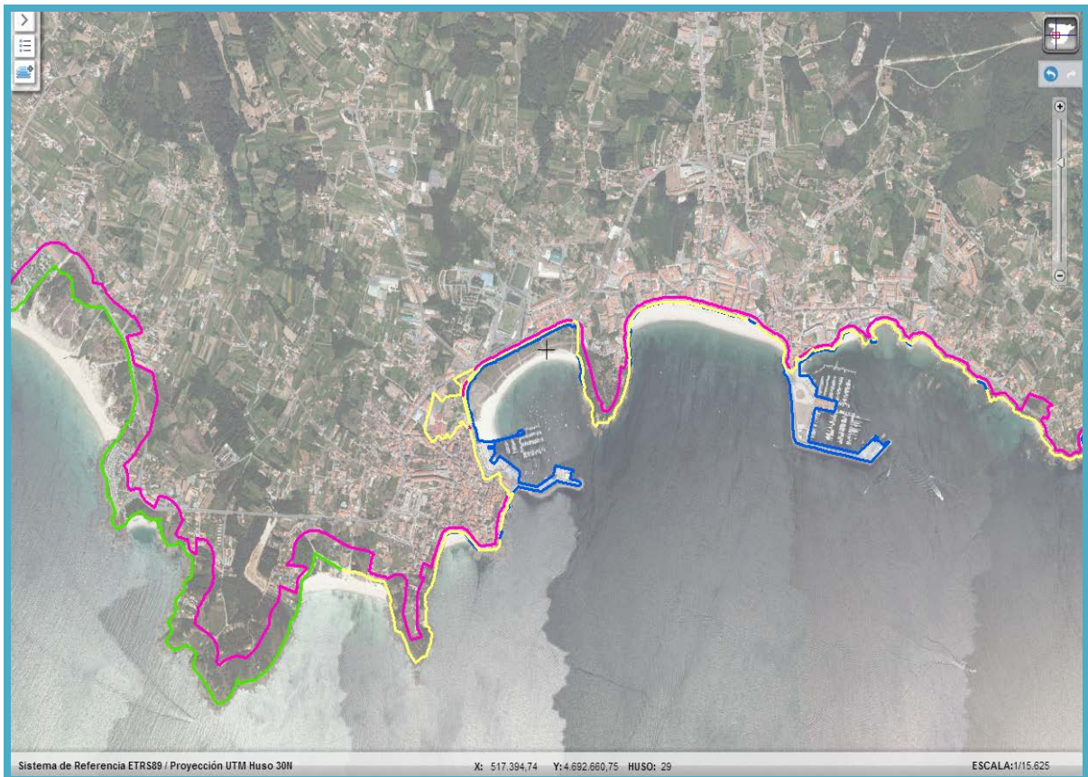
Imagen de detalle de la información del servicio

La cartografía incluida en este servicio contiene las zonas definidas como Deslinde DPMT y su correspondiente información alfanumérica asociada. Así como las zonas de exclusión de determinados núcleos de población y terrenos del dominio público marítimo-terrestre .